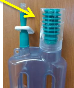
Accordéon en position haute : le redon n'est plus efficace