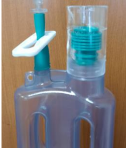
Accordéon en position basse : le redon fonctionne bien