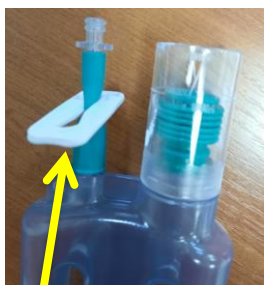
Fermer au niveau du flacon

d) Fermer (clamper : mettre sur la partie la plus fine) les clamps du redon à changer (bouteille + tubulure), se trouvant sur votre redon actuel à changer et sur la tubulure (tuyau transparent). Vérifier que le nouveau redon soit clampé (cf. photos).