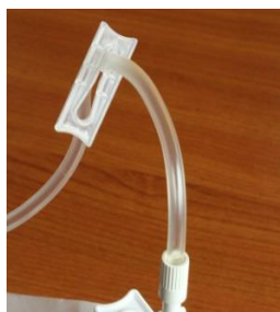
Fermer également celui le long du tuyau

Ne pas hésiter à forcer pour mettre les clamps car cela peut-être un peu dur !!